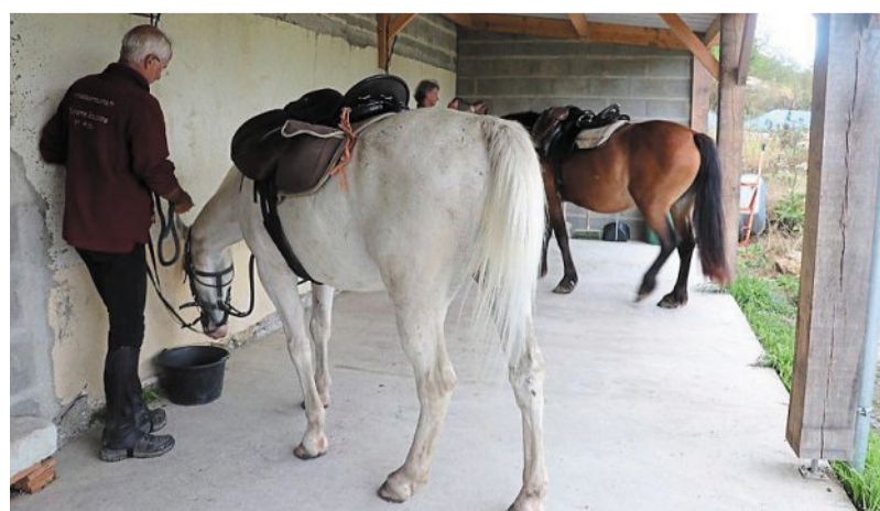
En raison du covid-19, les cavaliers ne peuvent ni préparer, ni desceller leur monture.