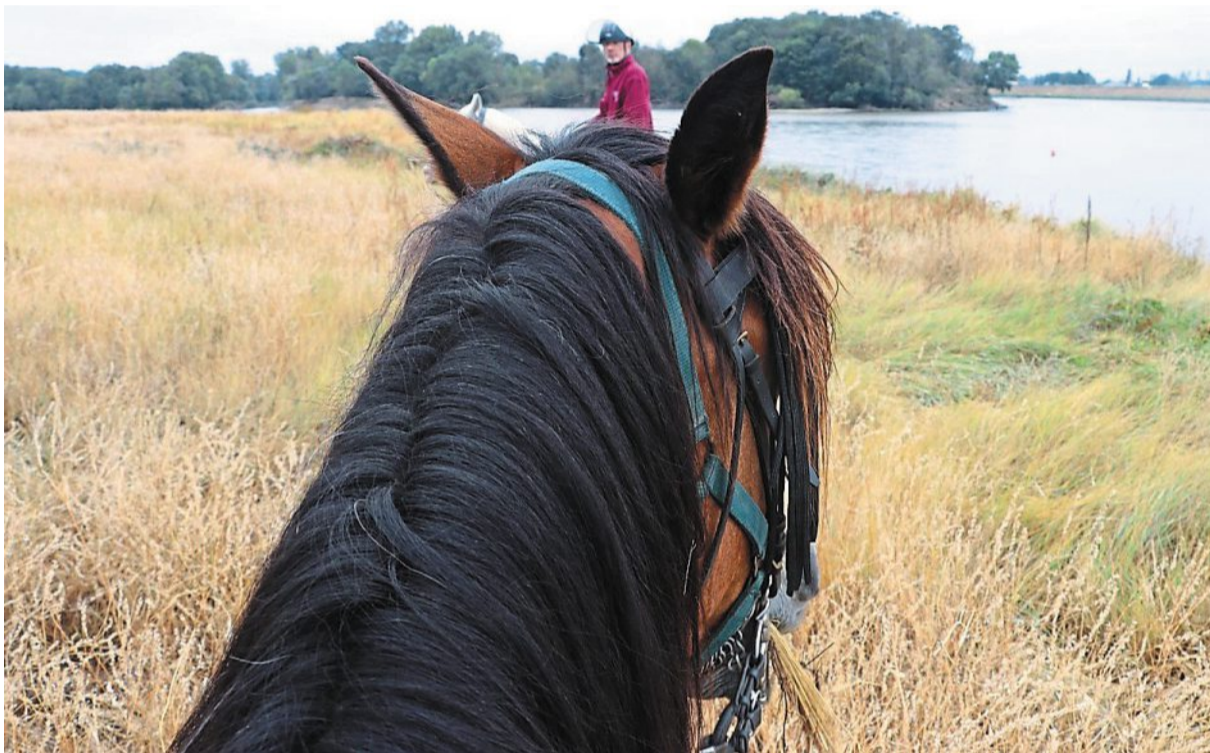
Régis regarde régulièrement l'application Vigicrue pour prévenir les risques des bords de Loire.

À peine sortis du bois des Vikings, nous contournons le majestueux château hôtel 4 étoiles du Prieuré, récemment rénové. « Certains trouvent l'intérieur kitch car les chambres sont décorées comme à l'époque de Napoléon III, l'un de ses propriétaires... C'est top d'y aller boire un verre. La vue est belle. » On ne s'arrête pas. Nos canassons sont déjà embarqués dans la descente, direction la Loire. « Il faut maintenant descendre pour emprunter un petit chemin étroit. Tu