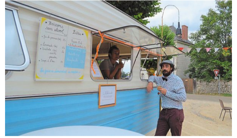
Une caravane itinérante, l'Aldébarante, se déplace dans les villages.