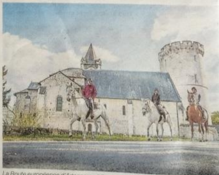
La Route européenne d'Artagnan est l'occasion de découvrir toutes les richesses patrimoniales à visiter sur les bords de Loire.