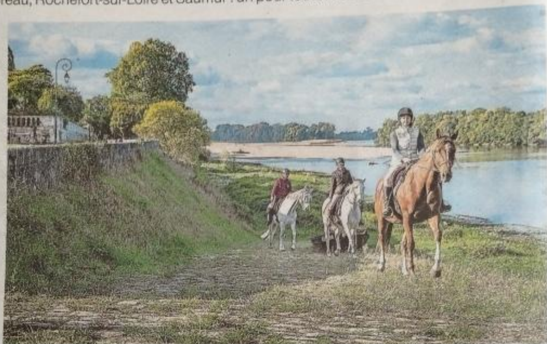
La Route européenne d'Artagnan en Maine-et-Loire sera inaugurée du 9 au 11 mai, à Beaupréau, Rochefort-sur-Loire puis Saumur. Avec des panoramas à savourer pour les cavaliers d'Anjou et de passage.

Rendez-vous dès jeudi (Ascension), à 11 h, à l'Hippodrome de la Prée à Beaupréau, pour entamer la fête. Au programme, des animations variées pour plaire aux petits comme aux grands : balades en calèche, réalisation de mini-fer à cheval par un maréchal-ferrant, rencontre avec des professionnels du monde équestre, marché de produits équins, d'artisans et commerçants locaux, démonstration de dressage... Avant un grand spectacle équestre nocturne, qui transportera les spectateurs au temps des mousquetaires.